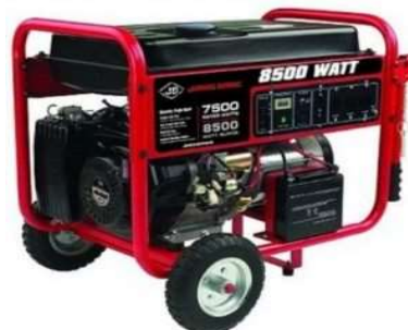
↑ جیانگ دانگ jiangdong ۸۵۰۰ وات و ۵۵۰۰ وات