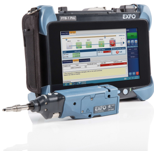
↑ مدل EXFO FTB-۱ PRO