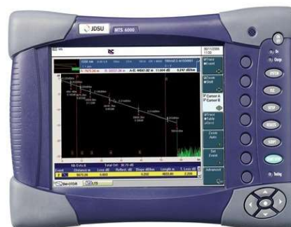
↑ JDSU MTS-۶۰۰۰