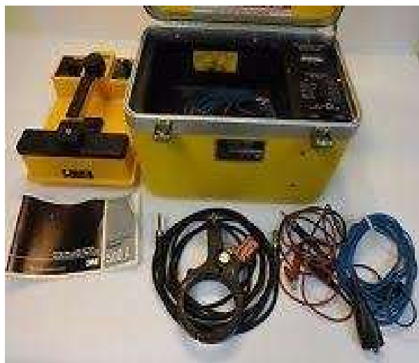
۳M™ Dynatel™ ۵۰۰ A ↑