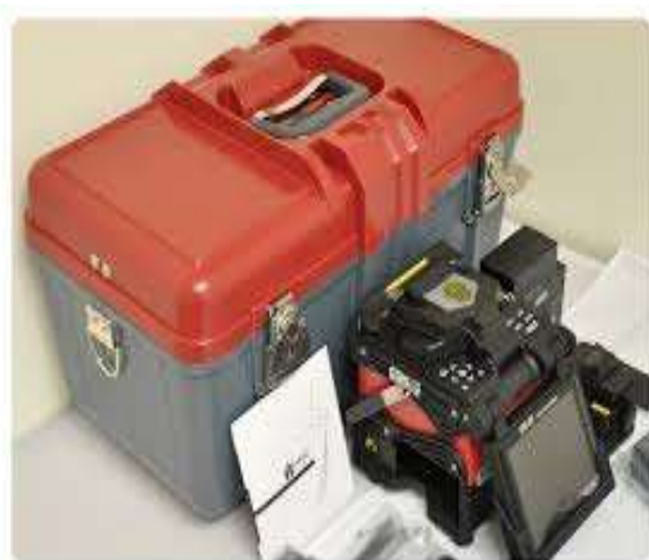
INNO Instrument IFS-۹ ↑