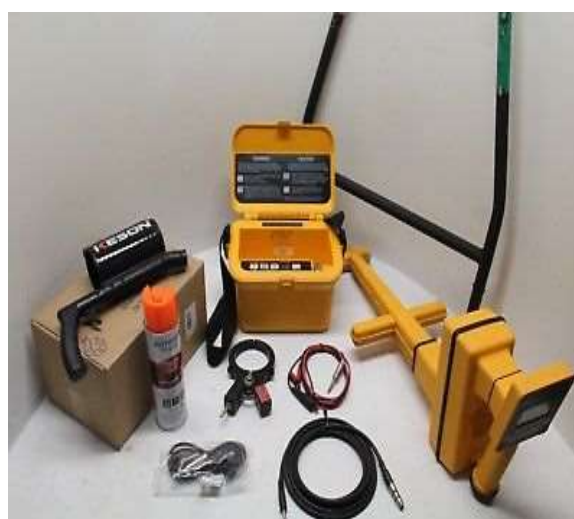
۳M™ Dynatel™ ۲۲۷۳ ↑