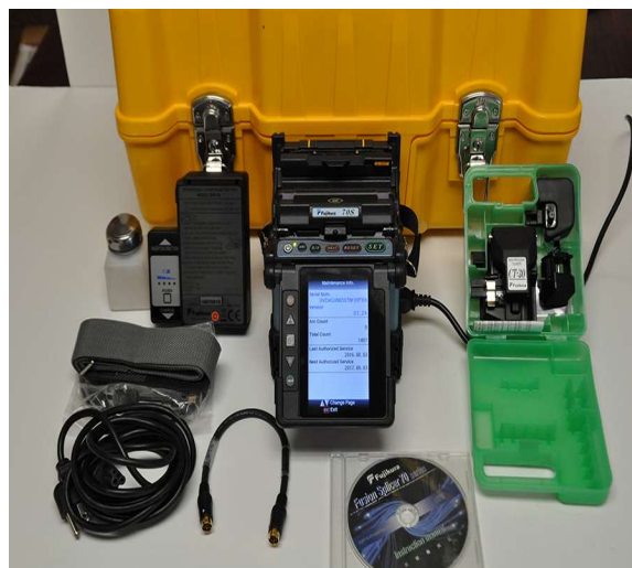
Fujikura LID ۷۰S ↑